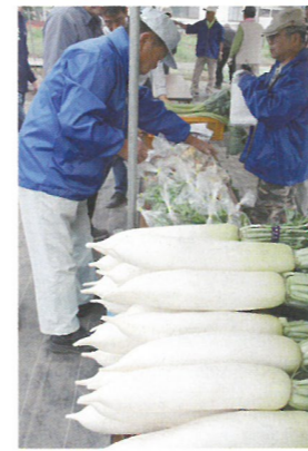
野菜の直売 戸崎の大根

「戸崎公園から花の丘農林公苑に向かう途中に浅間神社があり、今でも毎年7月の第1(日)に初山が厳かに行われています。また、戸崎の畑からは朝な夕なに富士山を見ることができ、関東の富士見百景に登録され、地域が富士山に見守られていることを誇りにも感じて暮らしています。」 「5月には戸崎の信号交差点付近にて、同協議会が主催で休耕地を活用したポピー祭りを開催しています。600坪の土地には、5月中旬に花が咲くように10月半ばに種まきを行います。祭り当日は、ポピーの切り花を無料で配ったり、戸崎産の野菜を直売したりし